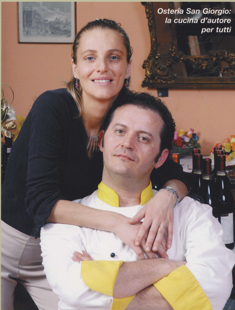
Osteria San Giorgio: la cucina d'autore per tutti

LA RIVISTA PER VIVERE E SCOPRIRE BERGAMO